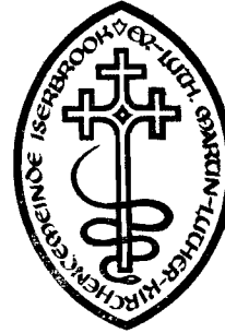
Nordelbisches Kirchenamt Kramer

Die Umschrift des Kirchensiegels lautet: Ev.-Luth. Martin-Luther-Kirchengemeinde Iserbrook.