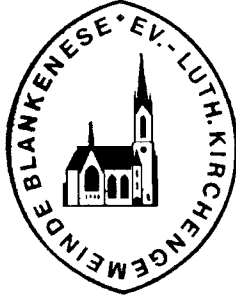
Nordelbisches Kirchenamt Kramer

Die Umschrift des Kirchensiegels lautet: Ev.-Luth. Kirchengemeinde Blankenese.