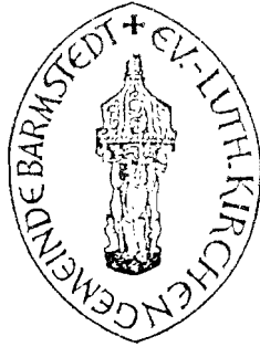
Nordelbisches Kirchenamt Im Auftrage Görlitz

Kirchengemeinde: Basthorst Kirchenkreis: Herzogtum Lauenburg Die Umschrift des Kirchensiegels lautet: Evang.-Luth. Kirchengemeinde Basthorst.