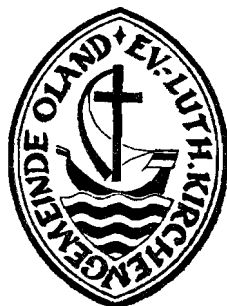
Nordelbisches Kirchenamt Göldner

Die Umschrift des Kirchensiegels lautet: Ev.-Luth. Kirchengemeinde Oland.