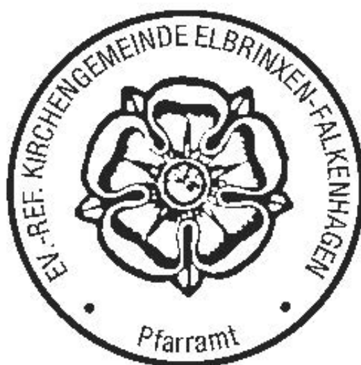
Einheitsiegel der Lippischen Landeskirche (hier: Ev.-ref. Kirchengemeinde Elbrinxen-Falkenhagen)